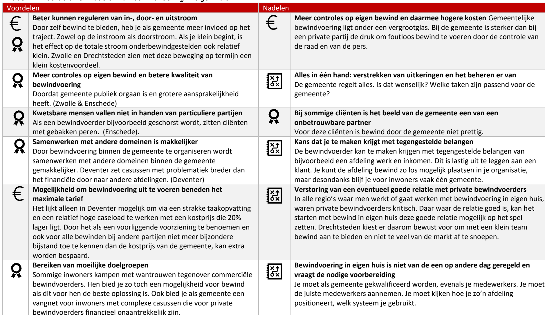
Tabel 4.1 Voordelen en nadelen van bewindvoering in eigen huis